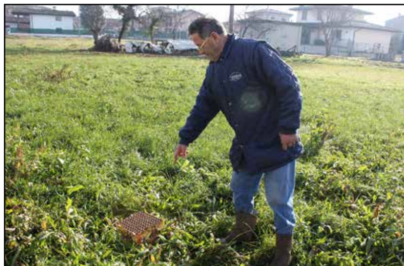
Uno dei tanti ordigni situati nel campo dei fratelli Colombo.

In verità questo appezzamento è tuttora oggetto di un contenzioso con l'Ammini-