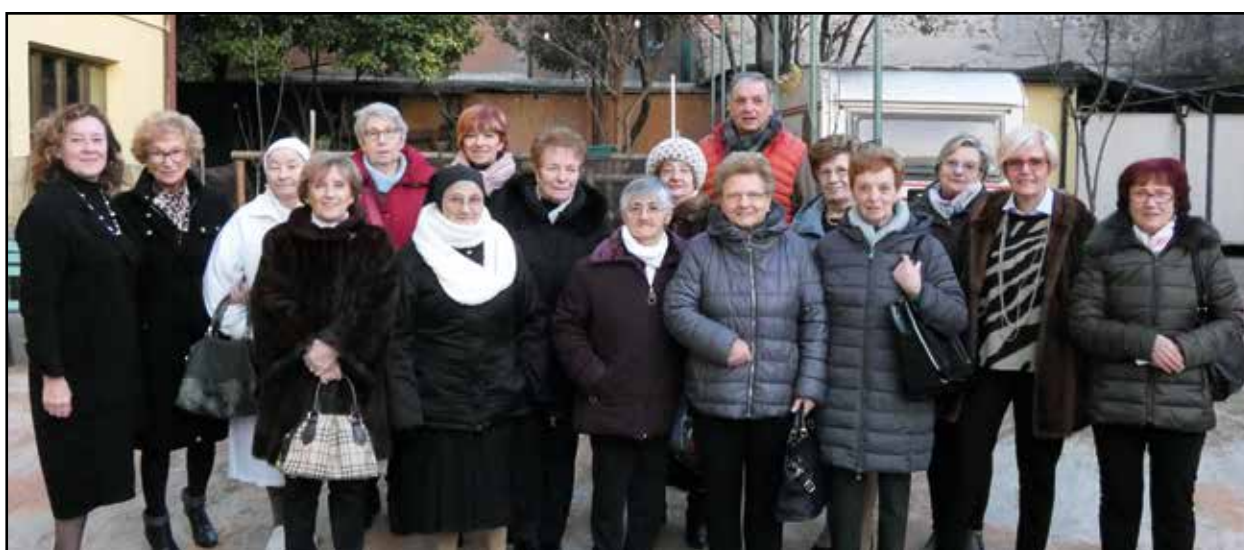
Alcune delle orfanelle presenti alla rappresentazione con l'Editore del libro.