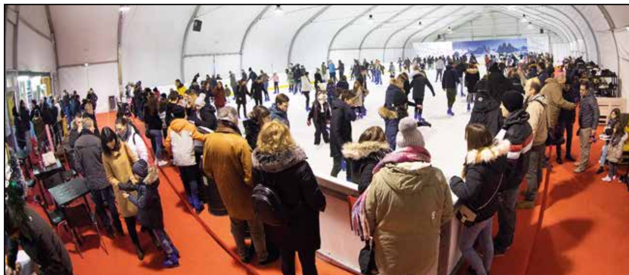
Record di persone al Palaghiaccio di Montichiari, l'avvenimento più partecipato delle feste natalizie.